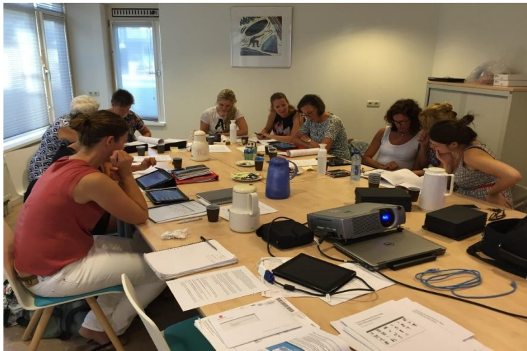
Figuur 3: Training van professionals in SamenStarten App en dataregistratie voor kosten-baten analyse

App. Begin november hebben interviews plaatsgevonden. Verschillende casussen werden besproken van een huisbezoek dat al gedaan was. Ook zijn we heel praktisch met de app aan de slag gegaan. Dat werkte goed omdat je veel van elkaar kan leren.