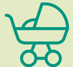
NA DE GEBORTE