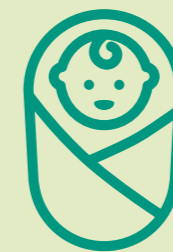
ROND DE GEBORTE