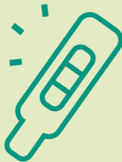
VROEG IN DE ZWANGERSCHAP