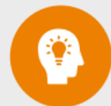
Ontwerpelement 3 Verwachtingen