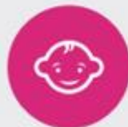
Ontwerpelement 8 Aansluiten bij de basis- behoeften van de baby