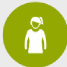
Ontwerpelement 1 Definiëring van doelgroep(en)