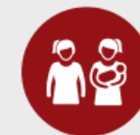
Ontwerpelement 6 Goede voorbeelden