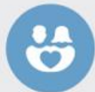
Ontwerpelement 7 Aansluiten bij de partner en sociale omgeving