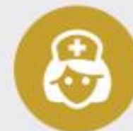
Ontwerpelement 9 Aansluiten bij de geboortezorg