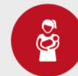
Ontwerpelement 5 Acties