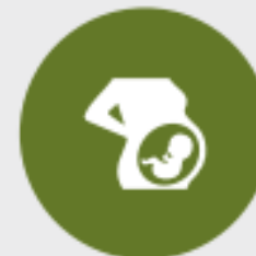
Ontwerpelement 2 Definiëring periode(n) van borstvoeding