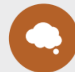
Ontwerpelement 4 Borstvoedingswensen